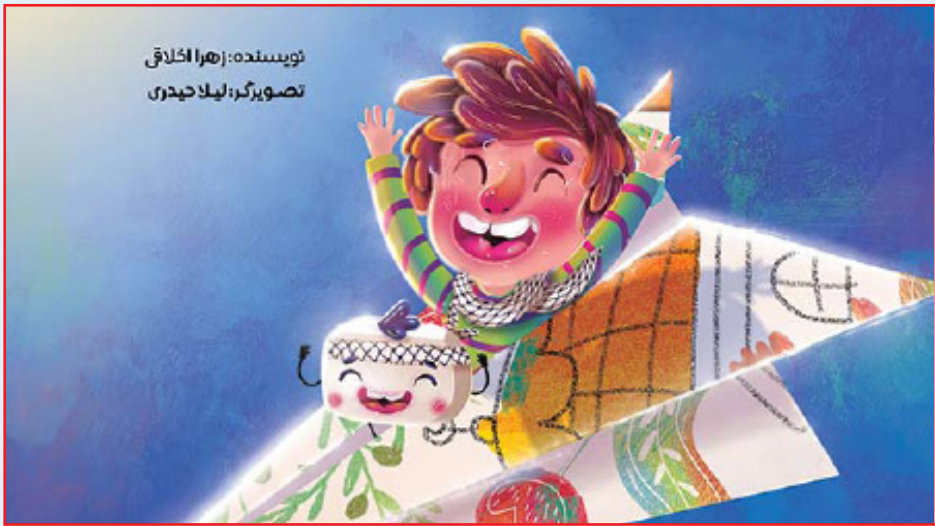
نویسنده: زهرا اخلاقی تصویرگر: لیلا حدادی