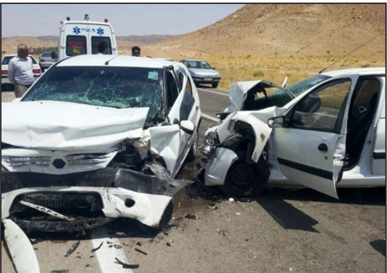
طرح نو؛ گروه گزارش

نیمة نخست امسال هرچند شاهد سوانح جاده‌ای و شهری بسیاری در آذربایجان غربی بودیم ولی با برنامہ ریزی‌های انجام‌شده، کاهش تلفات سوانح جاده‌ای آماری بود که در روزهای ابتدایی مهر اعلام شد که به نظر می‌رسد این روند کاهش، برای استان بسیار لازم بود ولی همچنان کافی نیست و باید تداوم روند کاهش در دستور کار باشد.