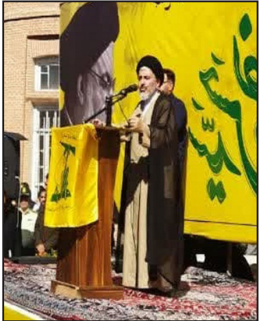
طرح نو؛ گروه گزارش

وی با اشاره به تأکید مقام معظم رهبری فرمودند درخصوص پیروزی نهایی حزب الله ادامه داد: رژیم غاصب و کودک‌کش صهیونیستی با عنایات خداوند متعال به دست رزمندگان مقاومت به کام مرگ خواهد رفت.