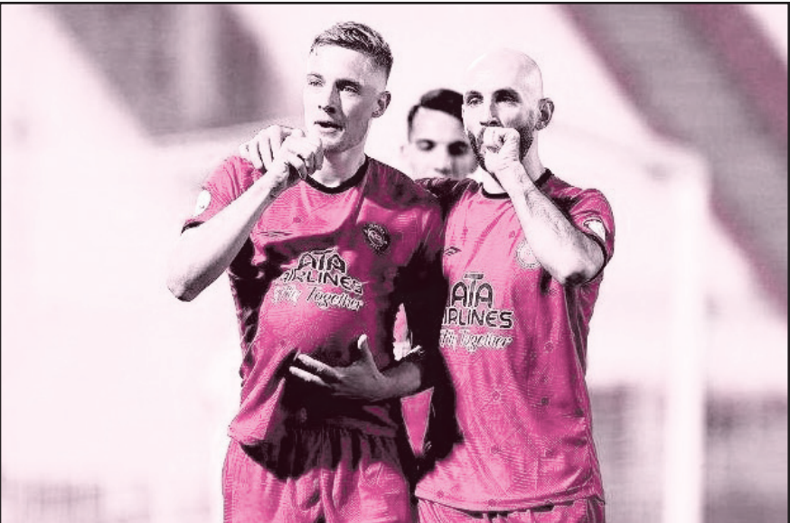
کاملاً به کارش متعهد است.