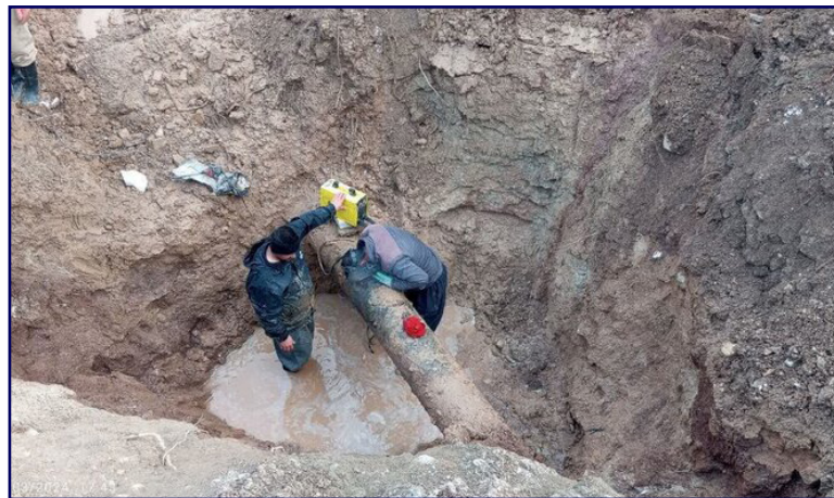
شرب و بهداشت عمومی در شهرستان خوی است. واگذاری انشعابات آب و فاضلاب در

راستای افزایش کیفیت زندگی شهروندان و توسعه زیرساخت های آبی انجام شده است. سلطانی همچنین به برنامه های آینده این شرکت اشاره کرد و گفت: «ما در تلاش هستیم تا با اجرای پروژه های جدید، به توسعه شبکه آب و فاضلاب شهرستان ادامه دهیم و نیازهای روزافزون شهروندان را برآورده کنیم. امیدواریم با همکاری و مشارکت مردم، شاهد افزایش رضایت مندی در این زمینه باشیم.» مدیرعامل شرکت آب و فاضلاب خوی در پایان، از شهروندان خواست تا در مصرف بهینه آب کوشا باشند و هرگونه مشکل یا درخواست خود را با این شرکت از طریق سامانه ۱۲۲ در میان بگذارند.