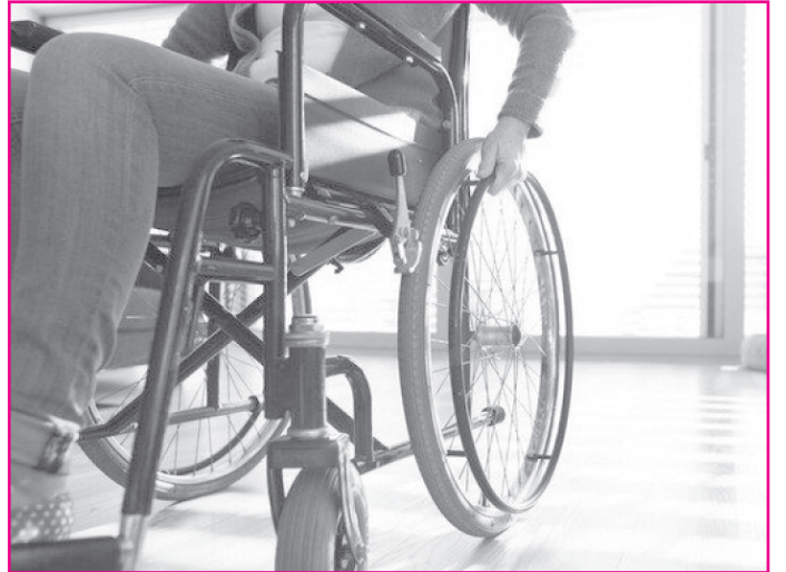
طرح نو؛ گروه خبر

مدیر اجرایی انجمن دفاع از حقوق معلولان ایران درباره وضعیت اسکان معلولان می‌گوید: علی‌رغم تبلیغات بسیار گسترده در خصوص خانه‌دار شدن خانواده‌های دارای دو عضو معلول و بیشتر، هنوز بسیاری از خانواده‌های دارای دو معلول فاقد مسکن هستند و همچنین وضعیت بسیاری از معلولان در مسکن ملی نیز نامشخص است.