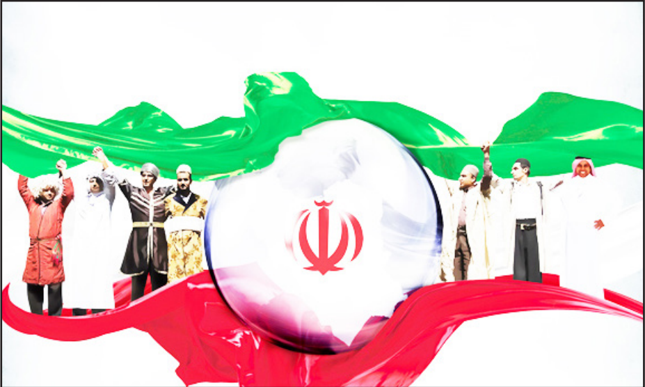
طرح نو، سردبیر

هویت ملی ایران همواره یکی از پیچیده‌ترین و غنی‌ترین هویت‌های منطقه‌ای بوده است. این هویت، برخلاف بسیاری از هویت‌های ملی نوظهور در دوران مدرن، بر پایه‌ی یک گذشته‌ی تاریخی چند هزار ساله، یک پیوستگی تمدنی عمیق، و یک شبکه‌ی پیچیده از تعاملات فرهنگی و زبانی بنا شده است. با این حال، در دهه‌های اخیر، به‌ویژه با گسترش فضای مجازی و مداخلات ژئوپلیتیکی در غرب آسیا، روایت‌هایی مطرح شده‌اند که تلاش می‌کنند ساختار تمدنی ایران را به شکلی تقلیل‌گرایانه، صرفاً بر پایه‌ی مناسبات قومی-زبانی بازتعریف کنند. مهم‌ترین این روایت‌ها، ایده‌ی «سلطه‌ی فارس‌ها» بر سایر اقوام ایرانی و «فاتیسم فارس‌محور» است. این روایت، یک اغلب در محافل قوم‌گرا و با حمایت بازیگران بیرونی بازتولید می‌شود، سعی در تجزیه‌ی هویت تاریخی ملت ایران به اجزای قومی مجزا و غالباً متخاصم دارد. هدف این مقاله تحلیل این گفتمان از منظر تاریخی، جامعه‌شناختی و ژئوپلیتیکی است تا نشان دهد چگونه افسانه‌ی «فارس‌های فاتیسم»، بیشتر یک ابزار سیاسی برای تضعیف انسجام ملی است تا بازتابی از واقعیت‌های موجود در پیکره‌ی جامعه و تاریخ ایران.