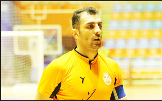
طرح نو؛ مریم دالانی قدیم

در فوتبال و فوتسال ایران، گویا هنوز قرار نیست «احترام به اسطوره» معنا پیدا کند. در روزگاری که وفاداری و غیرت ورزشی عنصر کمیاب است، کنار گذاشتن بازیکنی چون فرهاد فخیم از سوی بی‌غم سرمربی مس سونگون ورزقان، چیزی فراتر از یک تصمیم فنی به نظر می‌رسد؛ بوی لجاجت و غرور از آن به مشام می‌رسد.