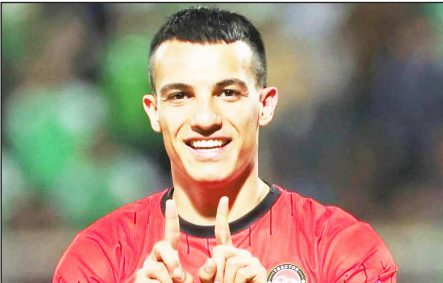
توانسته به تنهایی ۷ گل بزند!