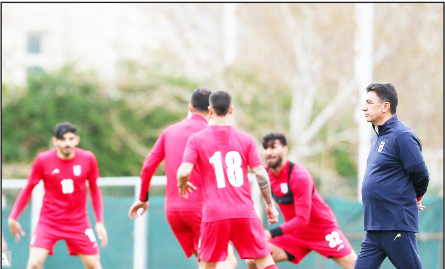
طرح نو؛ گروه ورزش

فهرست فعلی تیم ملی آخرین فرصت برای خودنمایی ملی‌پوشان تا فروردین آینده است و یک فیفادی بسیار کلیدی به شمار می‌آید.