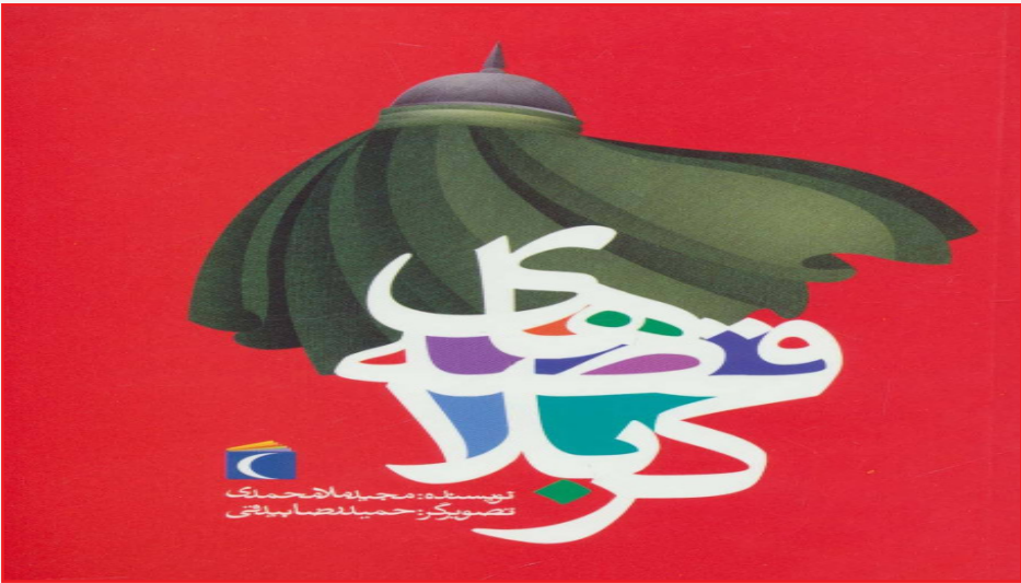
نویسنده: مجید ملامحمدی تصویرگر: حسین غفرانی

تمام مقاطع مختلف عاشورا به نظر من برای بچه‌ها جذاب و شیرین است اما یک نکته خیلی جذاب به نظر من این است که به روایت قدم‌به‌قدم و گام‌به‌گام شخصیت‌های مثبت و منفی حادثه کربلا، چه یاران حضرت(ع) و چه آنهایی که در صف مقابل قرار داشتند، پرداخته شود. روایت گام‌به‌گام حرکت آنها و پیوستن به سپاه خودشان تا زمانی که یاران حضرت شهید می‌شوند یا دشمنان حضرت(ع) سزوتشت دیگری پیدا می‌کنند، مهم است. اینکه چرا حرکت کردند؟ چرا به این سپاه پیوستند؟ چه هدفی داشتند؟ چگونه به این راه آمدند؟ نگاهشان به این حماسه بزرگ چه بود و به چه عاقبتی رسیدند؟ آیا عاقبت‌به‌خیر شدند؟ یا عاقبت‌به‌شر گرفتار؟ به نظر من این بهترین سوژه می‌تواند برای حماسه آسمانی امام حسین(ع) باشد که جای کار زیادی دارد. شخصیت حضرت سیدالشهدا(ع) و اصحاب و یاران، به‌خصوص خانواده و شهدای بنی‌هاشم(ع)، نیز هر یک به شکل مجزا ظرفیت کار دارند. به نظر من در این زمینه موضوعات کار نشده زیادی برای مخاطبان کودک و نوجوان وجود دارد. من خودم ده‌ها سوژه در ذهن دارم که علاقه دارم روزی کار کنم، ان‌شاءالله خدا توفیق بدهد. به نظر هیچ‌کس در این زمینه تنها نیست؛ نویسندگان کودک و نوجوان ما همگی علاقه‌مند به کار در این حوزه هستند و برخی آثار خوبی