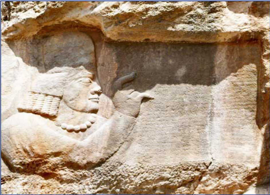
نزدیک است (احسن التقاسیم ص ۳۷۸)

طرح نو؛ سردبیر آنچه امروز ما آن را زبان فارسی می‌نامیم، پیشینه شگفتی را پشت سر گذاشته است. از ساختار واجی تا دستور. زبان فارسی در گذشته دارای جنس، شمار و پایانه صرفی بود. این ساختار با گذر زمان دچار تحول می‌شوند. این تحول در دوره میانه زبانی را تشکیل می‌دهد که در آن اثری بسیار ناچیزی از صرفی بودن پیداست و زبان به سوی تحلیلی شدن پیش می‌رود. از نظر علم زبان‌شناسی، در زبان صرفی شناسه‌ها نقش واژه را مشخص می‌کنند در حالی که در زبان تحلیلی (فارسی میانه، دری و فارسی نو)، ترتیب واژه‌ها (word order) یا حروف اضافه نقش را تعیین می‌کنند.