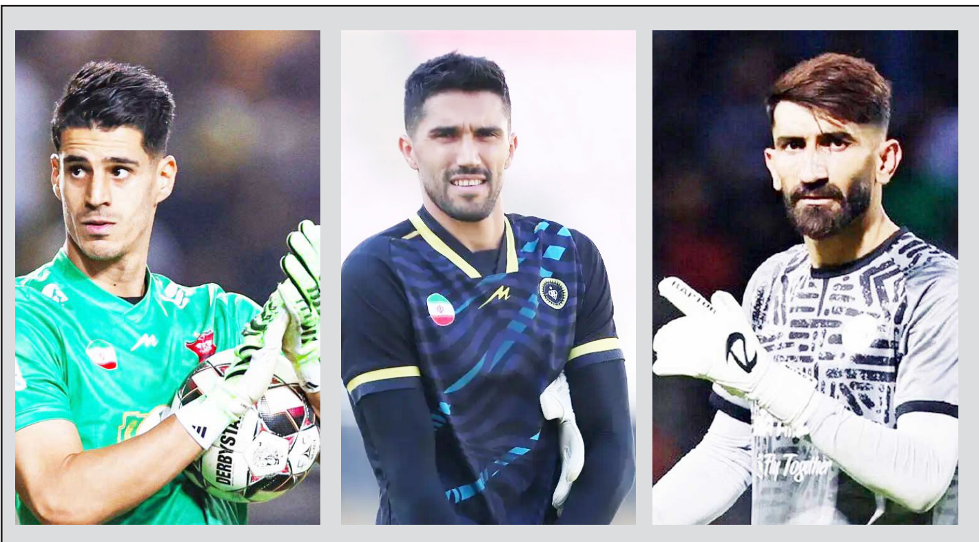
کمکی به تیم ملی کند.