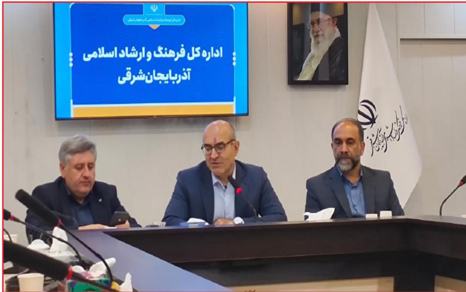
است. کارگردان اثر، افزود: این گونه آثار نشان می‌دهد که مردانی با تقدیر از دست‌اندرکاران این تئاتر به ویژه می‌توان با نگاهی هوشمندانه، هم نسل نو را جذب

طرح نو؛ گروه فرهنگ و هنر مدیرکل هنرهای نمایشی وزارت فرهنگ و ارشاد اسلامی بر تأثیر عمیق هنر نمایش در انتقال پیام‌های اخلاقی و انسانی تأکید کرد. به گزارش روابط عمومی اداره کل فرهنگ و ارشاد اسلامی آذربایجان شرقی، رضا مردانی در آیین رونمایی از پوستر نمایش «جمعه‌ای که تعطیل نبود» با محوریت زندگی شهید مدنی، اظهار داشت: استان آذربایجان شرقی مملو از بزرگان است که نه تنها در ایران که در کل جهان شناخته شده‌اند. علامه امینی، علامه طباطبایی، علامه جعفری، شهید قاضی و شهید مدنی از جمله این چهره‌های درخشان هستند. مدیرکل هنرهای نمایشی با اشاره به ظرفیت‌های بی‌ظنیر تئاتر در انتقال مفاهیم ارزشی و انسان‌ساز، خاطر نشان کرد: نمایش «جمعه‌ای که تعطیل نبود» اثر ارزشمندی است که می‌تواند برای نسل جوان بسیار تأثیرگذار باشد. پرداختن به زوایای انسانی زندگی شهدا همواره با استقبال گسترده مخاطبان روبرو شده