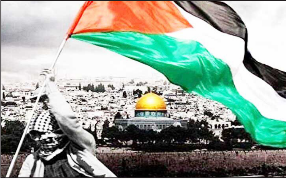
طرح نو؛ سردبیر

در شرایطی که نوار غزه درگیر یکی از تلخ‌ترین فصول تاریخ خود است و رژیم صهیونی گام‌های آشکار و پنهانی را برای اشغال کامل این منطقه برمی‌دارد، تحولات دیپلماتیک در سطح بین‌المللی، از جمله اعلام به‌رسمیت شناختن «کشور» فلسطین توسط برخی دولت‌ها مانند بریتانیا، با واکنش‌های متفاوتی روبرو شده است. این تصمیمات، که ظاهراً در جهت حمایت از آرمان فلسطین اتخاذ می‌شوند، در عمل چه وزنی دارند و آیا می‌توانند تغییری واقعی در معادلات میدانی و وضعیت وخیم انسانی ایجاد کنند؟ بررسی دقیق‌تر این پرسش‌ها، ما را به درک عمیق‌تری از ماهیت سیاسی و گاه تبلیغاتی این اقدامات رهنمون می‌سازد.