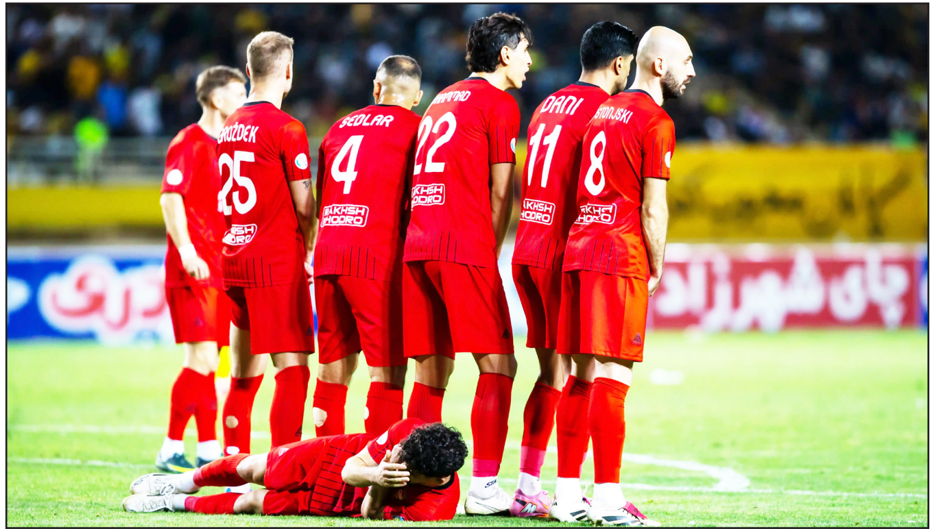
تیم‌ها ار در جدول جایه جا کند.

طرح‌تو؛ گروه ورزش به جز تراکتور که گلیم خود را از آب بیرون کشیده، مابقی مدعیان حال‌وروز خوشی ندارند و در این بین ساختار دفاعی‌شان به شدت متزلزل است. هفته چهارم پیکارهای فصل جدید لیگ برتر فوتبال ایران شب گذشته با انجام تقابل استقلال - پیکان و سپس سپاهان - تراکتور به پایان کار خود رسید که نگاهی به نتایج ثبت‌شده در هفته اخیر نشان می‌دهد که بازهم تیم‌های مدعی (به جز تراکتور) نتوانستند از بحران تاج شوند و همچنین در حسرت حضور در کورس تیم‌های بالانشین جدول هستند؛ از سپاهان که هنوز عدد صفر مقابل شمار بردهای لیگ برتری‌اش خودنمایی می‌کند تا استقلال و پرسپولیس که تشنه پیروزی‌اند و عطش‌شان را فعلاً پابانی نیست!