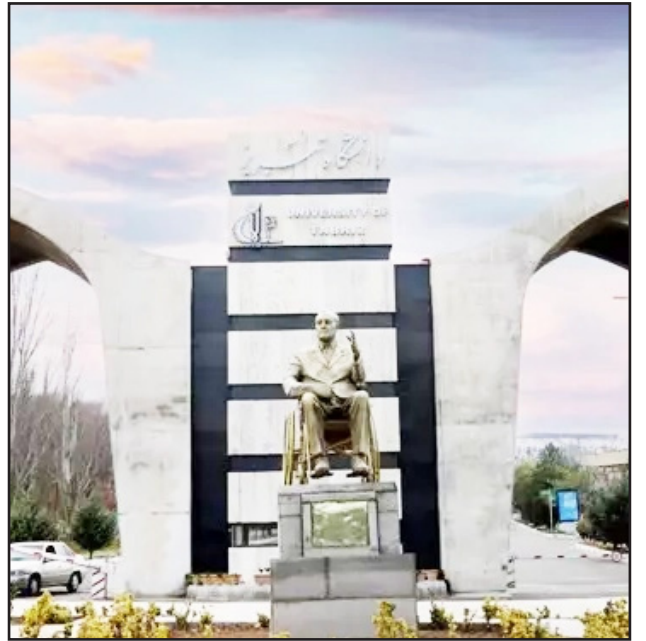
طرح نو؛ گروه چامعه

سردبیر: با بازگشایی مدارس و دانشگاه‌ها، نگاه‌ها بار دیگر به سوی کانون‌های علم و دانش معطوف می‌شود. در این میان، کلانشهر تبریز، نه تنها به عنوان یک قطب اقتصادی و فرهنگی، بلکه به عنوان یکی از پایگاه‌های تاریخی و پیشروی علمی ایران، جایگاهی منحصربه‌فرد دارد. جایگاهی که ریشه در تاریخ دارد و از عصر قاجار تا به امروز، تداوم یافته است.