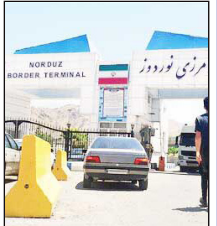
طرح نو، گروه خبر

رئیس نمایندگی انجمن دوستی ایران و ارمنستان در شمال غرب کشور با تأکید بر نقش راهبردی ارمنستان به عنوان دروازه ورود ایران به بازار ۲۰۰ میلیونی اتحادیه اقتصادی اوراسیا، از لزوم تسریع در تکمیل زیرساخت‌هایی همچون پل دوم نوردوز، جاده تبریز-وردوز و کریدور ارس برای توسعه مبادلات تجاری با این کشور همسایه خبر داد.