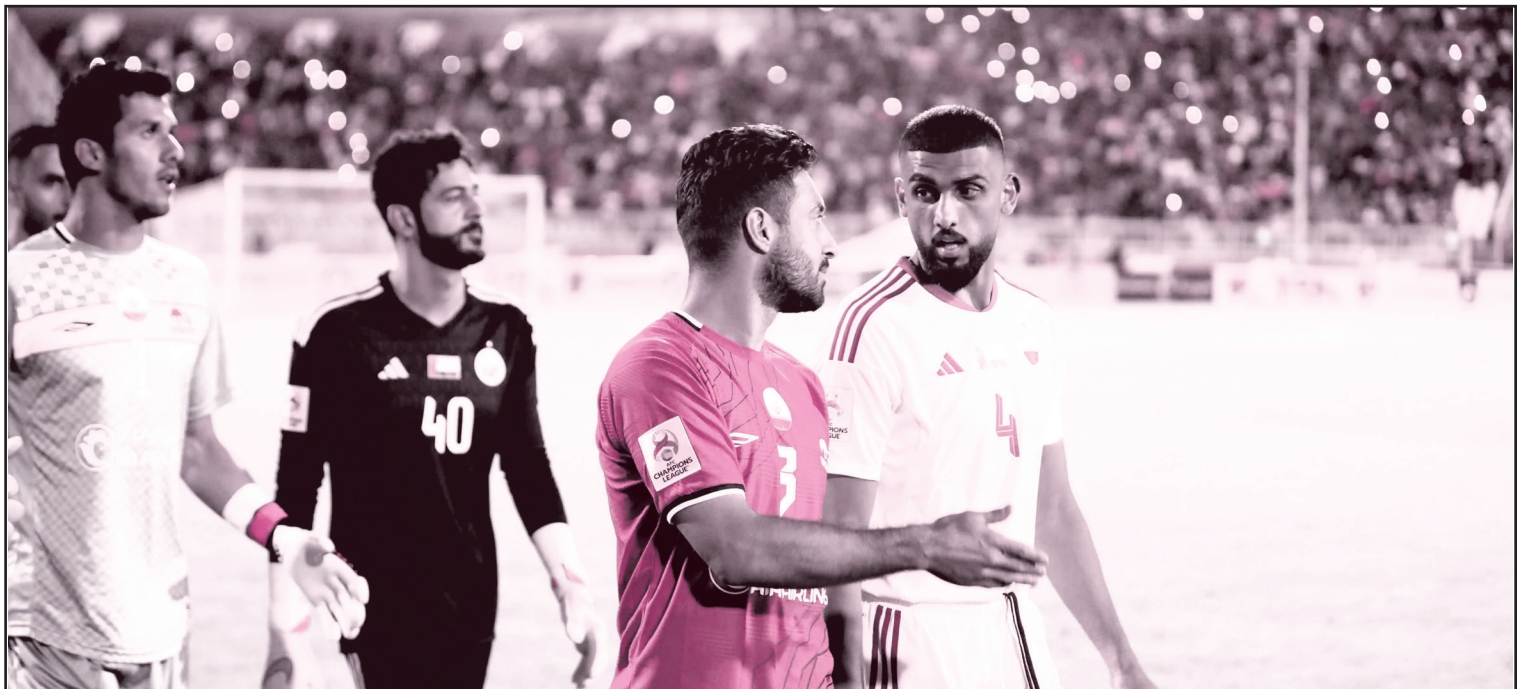
به دنبال انتقام‌گیری بعد از ۷۹۰ روز!