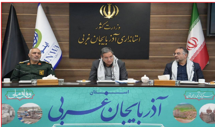
رحمانی همچنین با تشریح برنامه‌های جدید استان در حوزه محرومیت‌زدایی، اشتغال‌زایی و توسعه

وی در ادامه با اشاره به نقش آفرینی مثال‌زدنی بسیج در بحران‌ها و مأموریت‌های ملی چون مقابله با کرونا و اجرای طرح‌های محرومیت‌زدایی، افزود: مهم‌ترین سرمایه انقلاب، خدمت بی منت، روحیه ایثار، مسئولیت‌پذیری و حضور داوطلبانه بسیجیان است.