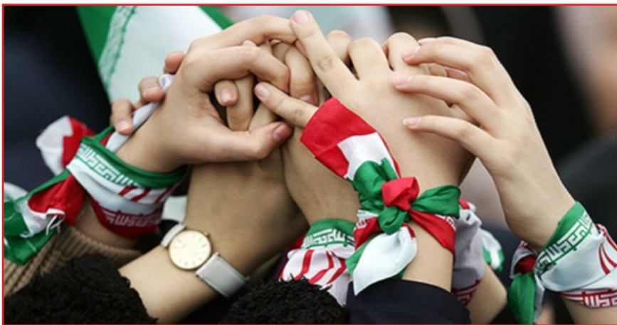
حوادث اخیر به وضوح لمس کردیم. اما چرا باید در میان این ثروت عظیم و سرمایه کردند و نمونه آن را از پیروزی انقلاب تا همین