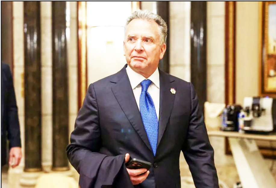
طرح نو؛ سردبیر

در شطرنج پیچیده‌ی سیاست خارجی ایالات متحده، همواره چهره‌هایی فراتر از کادرهای رسمی وزارت خارجه ظاهر می‌شوند که نقش «فرستاده ویژه» یا «کانال پستی» را بازی می‌کنند. استیون ویتکاف، سرمایه‌دار ۶۹ ساله و غول املاک و مستغلات آمریکا، جدیدترین و شاید کلیدی‌ترین مهره‌ای است که دونالد ترامپ برای گشودن گره‌های کور در روابط با ایران و روسیه برگزیده است. ویتکاف که پیش از این نامش تنها در محافل اقتصادی مہنتن و باشگاه‌های گلف شنیده می‌شد، اکنون به عنوان نماینده‌ای با نفوذ، وظیفه سنگین مذاکره در پرونده‌ای را بر عهده دارد که دهه‌هاست به بن‌بست رسیده است. او نه یک دیپلمات، بلکه یک استراتژیست معامله‌گر است که رفاقت دیرینه‌اش با ترامپ، به او قدرت مانوری بی‌نظیر بخشیده است.