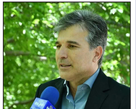
طرح نو؛ سردبیر