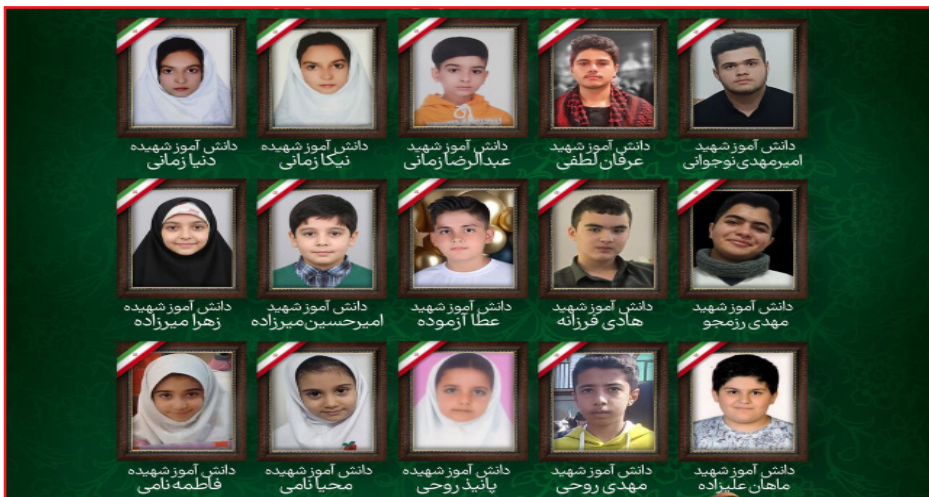
طرح نو؛ گروه خبر مدیرکل آموزش و پرورش آذربایجان غربی گفت: شهادت دانش‌آموزان در جنگ رمضان، جلوه‌ای از روحیه توحش و کودک‌کشی رژیم صهیونیستی و استکبار جهانی است که این لکه ننگ در تاریخ بشریت باقی خواهد ماند.