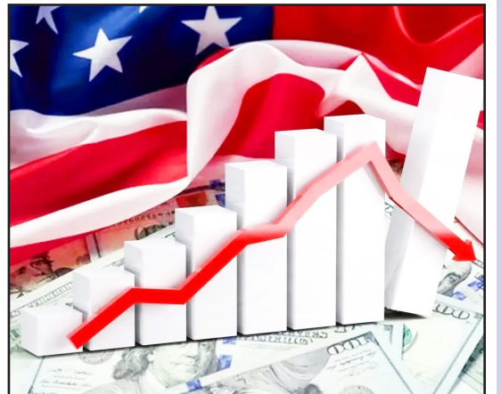
طرح نو؛ سردبیر

سیاست‌های تنش‌زای دولت دونالد ترامپ در قبال ایران، بار دیگر موجی از انتقادات داخلی را در ایالات متحده برانگیخته است. در تازه‌ترین مورد، «پرامیلا جایاپال»، نماینده بانفوذ کنگره آمریکا، برده از واقعیتی برداشته که نشان می‌دهد هزینه‌های این رویکرد خصمانه، نه از جیب دولتمردان، بلکه از سفره‌های مردم عادی تأمین می‌شود. به اعتقاد وی، پیوند عمیقی میان سیاست‌های جنگ‌طلبانه، بحران اقلیمی و فشار اقتصادی بر خانواده‌های کارگر وجود دارد.